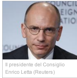
Il presidente del Consiglio Enrico Letta

Quello delle riforme costituzionali è «uno dei tre grandi obiettivi del governo nato a fine aprile con l'idea di concludere le riforme in 18 mesi: per ora il cronoprogramma è rispettato anzi siamo in anticipo e vogliamo continuare a tenere il punto». Lo ha detto il premier