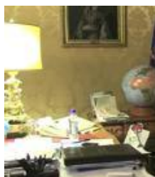
Letta: «Riforme costituzionali, uno dei tre obiettivi del governo»