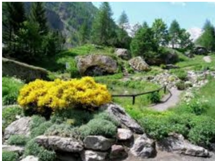
Il Giardino Paradisia

Il Giardino, situato in Valnontey a pochi chilometri dal centro di Cogne, a 1.700 metri di quota, deve il suo nome a Paradisia liliastrum, un giglio che con i suoi fiori candidi arricchisce le praterie montane naturali del sito