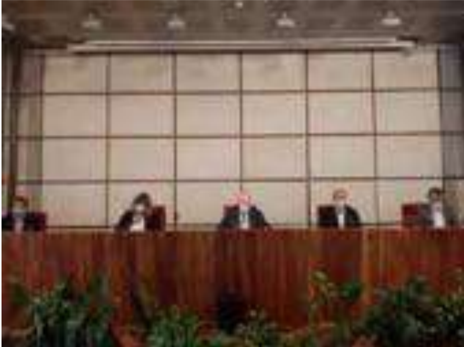
La Giunta della Regione autonoma Valle d'Aosta alla conferenza stampa di presentazione del disegno di legge coronavirus-3

Sono 25 le delibere adottate dalla Giunta della Regione autonoma Valle d'Aosta nel corso della riunione di venerdì 26 giugno 2020.