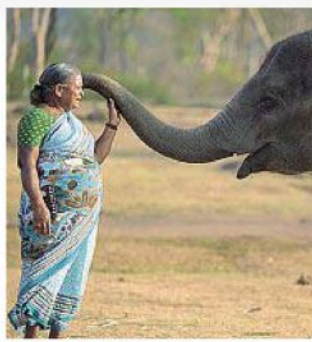
L'apertura Una scena del film The Elephant Whisperers

Il festival trasporterà gli spettatori in diversi ecosistemi, in presenza e sul web. «I registi provenienti da 14 Paesi ci spiegheranno, per esempio, come nasce un film "animalier", o perché abbiamo scelto di mostrare la grande bellezza della natura. Come nel film di